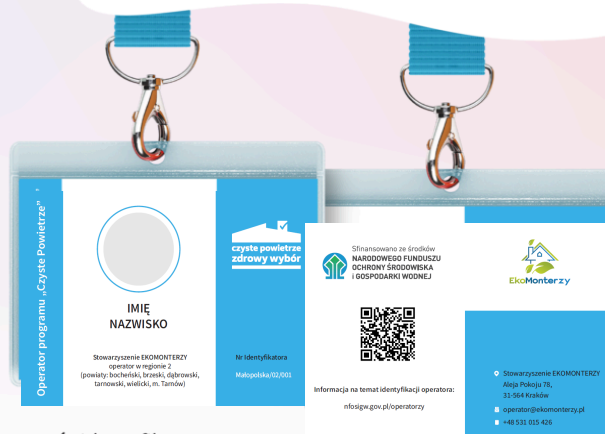
Wzór identyfikatora Operatora programu „Czyste Powietrze”