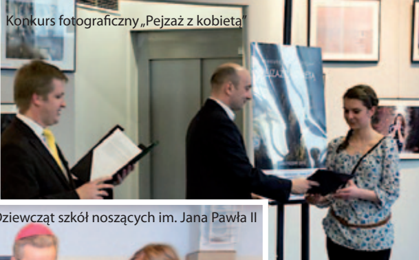
Konkurs fotograficzny „Pejzaż z kobietą”