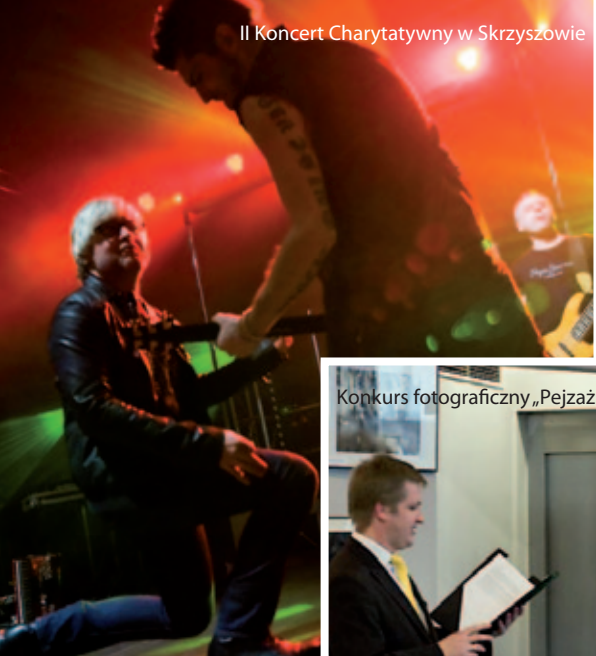
II Koncert Charytatywny w Skrzyszowie