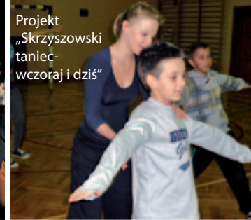
Projekt „Skrzyszowski taniec-wczoraj i dziś”