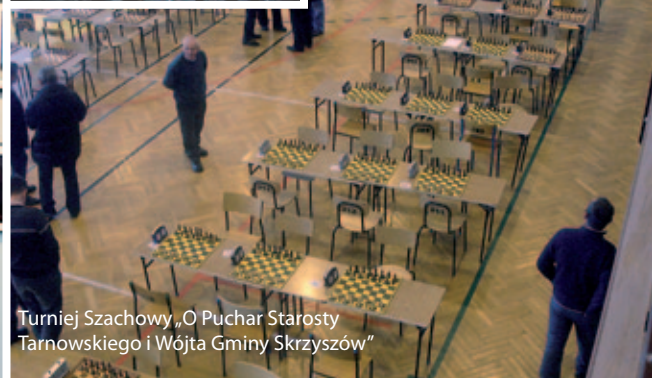
Turniej Szachowy „O Puchar Starosty Tarnowskiego i Wójta Gminy Skrzyszów”