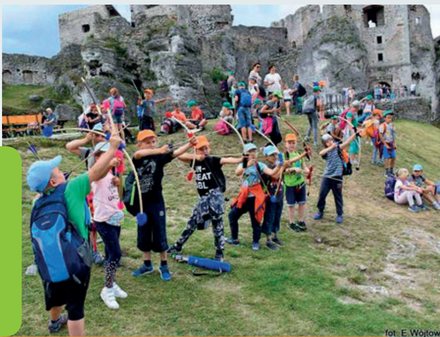
fol. E. Wojtow