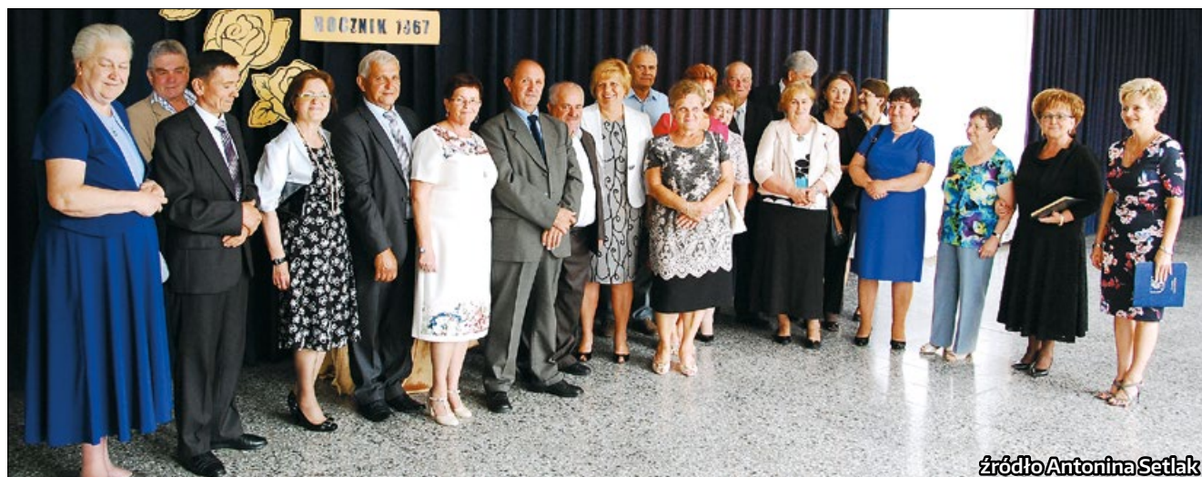
źródło Antonina Setlak