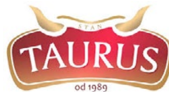
Stanisław Jarosz (Taurus)