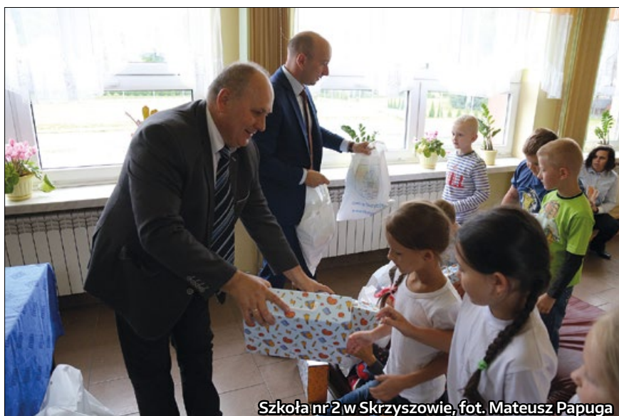
Szkoła nr 2 w Skrzyszowie