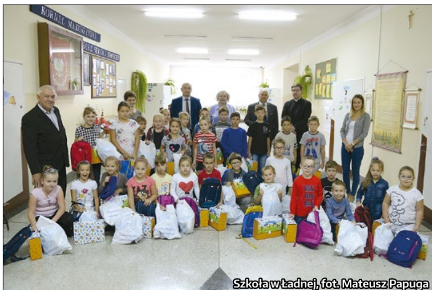
Szkoła w Ładnej, fot. Mateusz Papuga

We wszystkich szkołach naszej gminy od września są wdrażane e-dzienniki. W okresie wakacyjnym trwały intensywne prace związane z modernizacją sieci internetowej. Zostały również do tego celu zakupione komputery stacjonarne i laptopy, tak aby w każdej sali lekcyjnej mógł się znajdować komputer, z którego będą korzystać nauczyciele. E-dzienniki zastąpią tradycyjny papierowy dziennik. Rodzice i uczniowie otrzymają bezpłatny dostęp do e-dziennika, który umożliwi im szybką i wygodną komunikację ze szkołą.