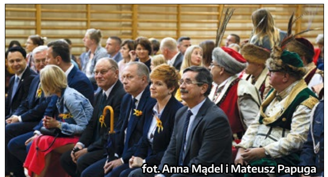
fot. Anna Mądel i Mateusz Papuga