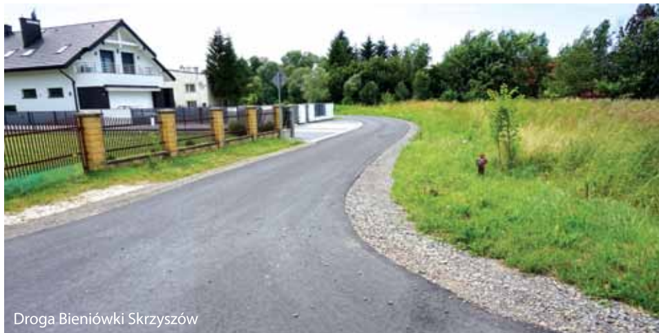
Droga Bieniówki Skrzyszów

Ponadto planowane jest wykonanie dokumentacji projektowej chodnika w stronę Skrzyszowa.